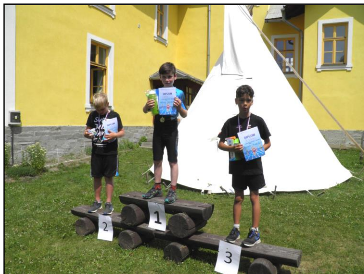
Lehkoatletické závody žáků ZŠ