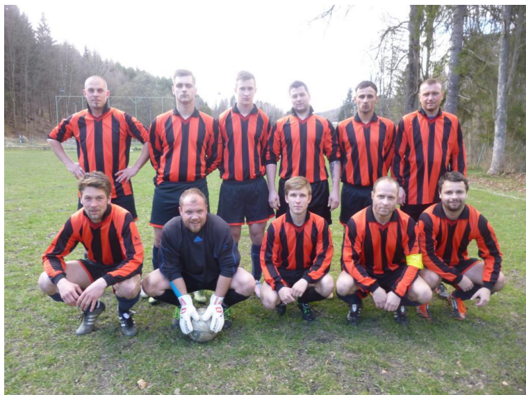
Tým mužů před prvním utkáním jarního kola