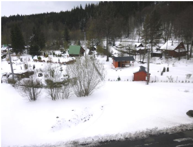
FOTO: S pořádnou nadílkou sněhu 19. dubna se k nám vrátila zima

V tomto období si přijdou na své také sportovci a fanoušci kolektivních sportů, soutěží a závodů. Fotbalisté ukončí jarní kolo svých soutěží, základní škola bude pořádát lehkooatletický trojboj žáků malotřídních škol (1.6.), dobrovolní hasiči hasičskou soutěž družstev „Memoriál Jiřího Hudáka (1.7.), TC Praděd „Výron CUP“ - turnaj ve volejbale (1.7.) a MTB Maraton horských kol (27.8.) a sportovní sezona bude ukončena turnajem „Krejča CUP“ v nohejbalu (2.9.)