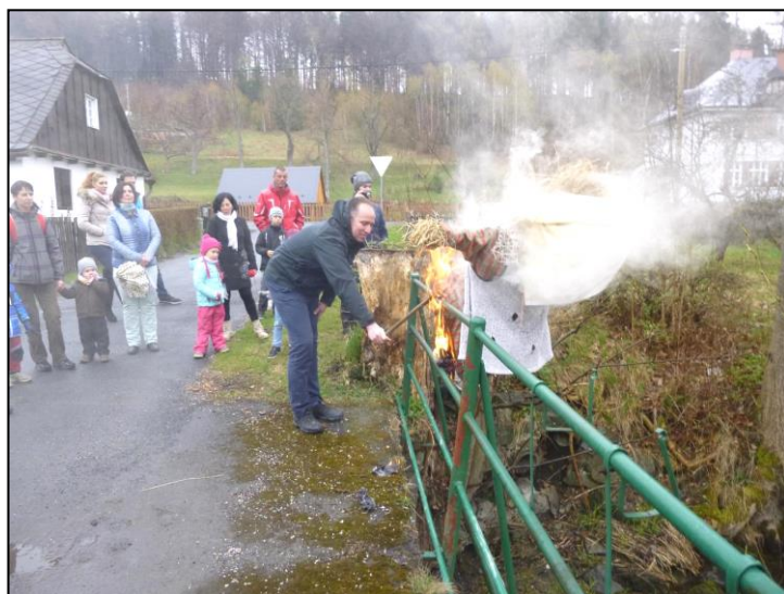
Nedávné místní akce