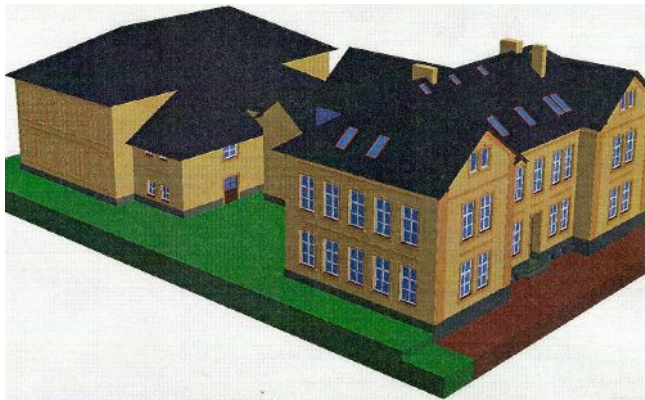
Studie přístavby tělocvičny