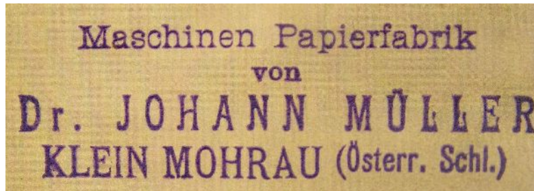
Původní označení firmy

v Ludvíkově) pomohlo papírnu i nadále rozvíjet a přes obě světové války udržet její prosperitu. V roce 1906 pořídil majitel do továrny plynový generátor na výrobu elektřiny a o rok později nechal elektrifikovat nejen hlavní provoz a Červenou továrnu, ale všechny budovy, které spravoval. Roku 1907 osvětlil celý úsek vesnice mezi penzionem Pod Kapličkou a restaurací Na Rychtě, tedy všechny vlastní i přilehlé budovy a nechal vztyčit veřejné osvětlení a předstihl tak o celých 20 let oficiální elektrifikaci vesnice.