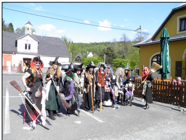
Vítání jara a čarodějnice