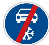
Dopravní značka „Zimní výbava - konec“