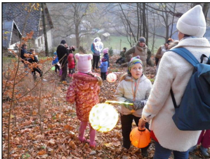
Setkání seniorů a Svatomartinská slavnost