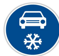
Dopravní značka „Zimní výbava“

Myslete nejen na svou bezpečnost, ale i na bezpečnost ostatních účastníků silničního provozu, kterou svou ignorací k zimní výbavě a jejím povinnostem můžete ohrozit.