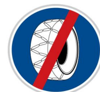
Dopravní značka „Sněhové řetězy - konec“