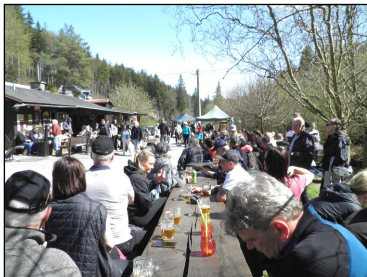
Jarní akce v obci